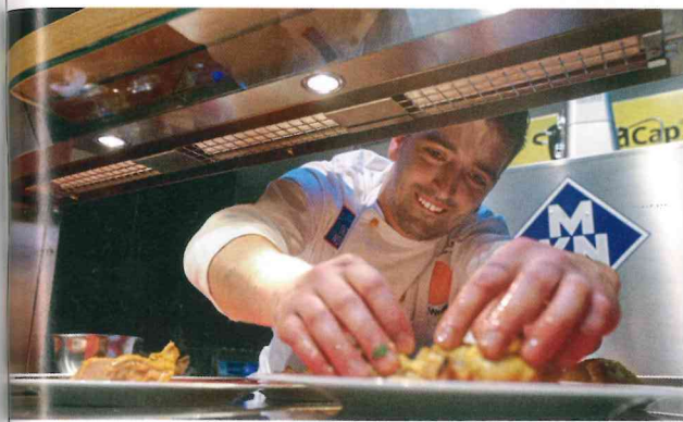
Die aktuellen Trends für den Außer-Haus-Markt in ihren unterschiedlichen Facetten zeigen die rund 1.300 Aussteller auf der Internorga